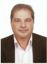
Δρ. Σάββας Σειμανίδης Πρόεδρος European Renewable Energies Federation (EREF)