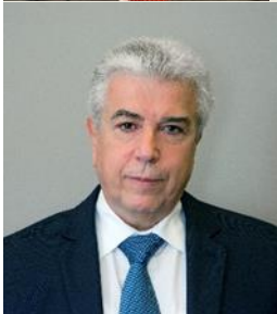
κ. Εμμανουήλ Παναγιωτάκης Πρόεδρος & Διευθύνων Σύμβουλος Δημόσια Επιχείρηση Ηλεκτρισμού (ΔΕΗ)