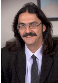
Δρ. Ιωάννης Καμπούρης Γενικός Διευθυντής ΑΔΜΗΕ