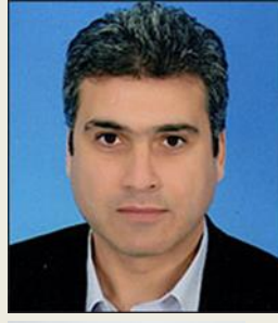
κ. Νίκος Μπουλαξής, Πρόεδρος ΡΑΕ