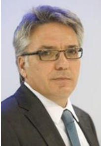
κ. Μιχάλης Βερροϊόπουλος Γενικός Γραμματέας Ενέργειας και Ορυκτών Πρώτων Υλών Υπουργείο Ενέργειας και Περιβάλλοντος