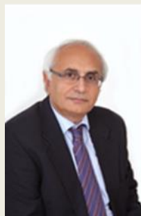
κ. Χρήστος Δήμας Πρόεδρος της Επιτροπής Γεωπολιτικής και Ενέργειας, Μέλος ΔΣ ΙΕΝΕ