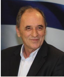
κ. Γ. Σταθάκη Υπουργός Περιβάλλοντος & Ενέργειας